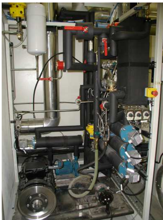
Circuit banc condenseur Condensor test bench