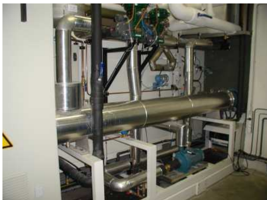
Circuit banc radiateur