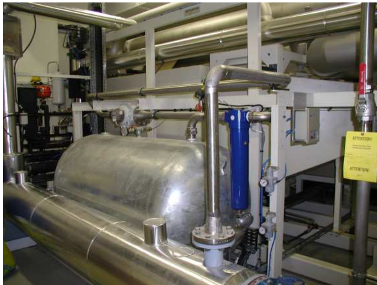
Circuit banc RAS RAS test bench