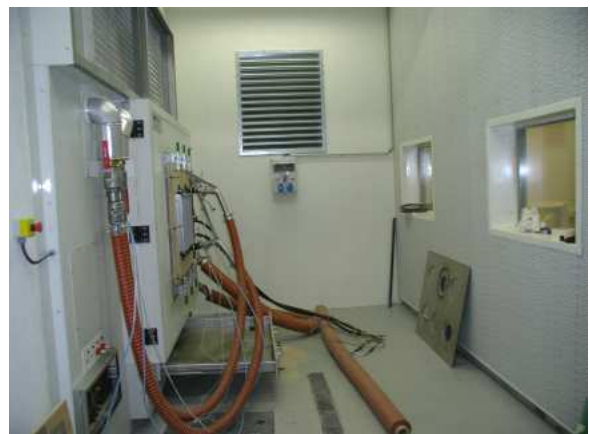
Salle d'essais veine d'air Tests chamber with airflow circuit