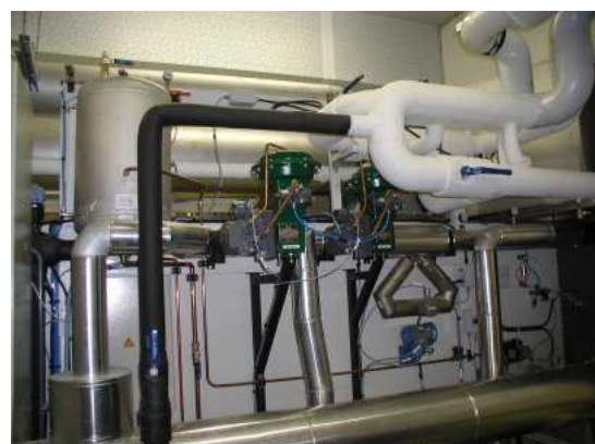
Radiator test bench